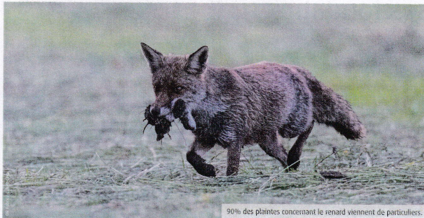
90% des plaintes concernant le renard viennent de particuliers.

Les Espèces susceptibles d'occasionner des dégâts (Esod) sont définies, pour chaque département, par arrêté ministériel tous les trois ans. La nouvelle liste sera dévoilée courant juillet. Dans la Vienne, la Ligue pour la protection des oiseaux (LPO) exprime son mécontentement.