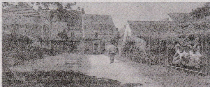
Dans la cour du donjon avec les photos d'Alexis Rosenfeld.

Ayant pour thème l'eau, le festival recevra plusieurs photographes français et étrangers de renommée internationale, dont l'invité d'honneur, Alexis Rosenfeld, photographe et plongeur professionnel, dans différents lieux emblématiques de la cité thermale: le donjon, le parc des Confluences, le parc thermal, les rives de la Creu-