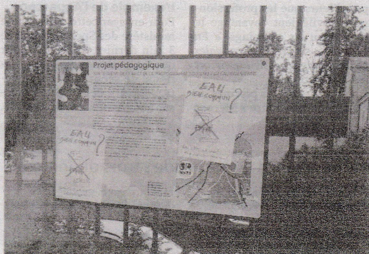
Des affiches « Eau, bien commun ? » ont été collées sur des panneaux de l'exposition Or Bleu Festival à La Roche-Posay.

Selon nos informations, la municipalité de La Roche-Posay, informée, a immédiatement alerté l'équipe de l'organisation du festival. Qui s'est empressée de tout nettoyer à l'éponge et à l'eau chaude... Soulagée, au